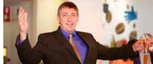
Hoog bezoek in Borgerhout dit najaar! p.3