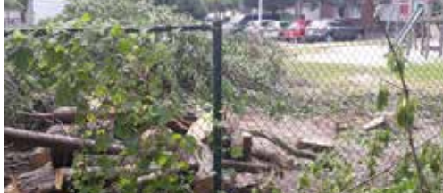
Groen opportunisme bij speelpleintje p.2